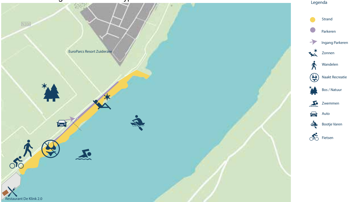
Afbeelding 4: Ellerstrand-Noord huidige situatie

Ellerstrand-Noord ligt aan het Veluwemeer tussen EuroParcs Resort Zuiderzee en restaurant De Klink 2.0 ter hoogte van een toekomstig recreatiepark op het Ellerveld. Het is een zeer uitgestrekt strand met een aantal baaien en afwisselend zand- en grasstrandjes. Door de ruime opzet is het een wat rustiger en extensiever gebruikt strand. Het zuidelijk deel hiervan is bedoeld voor naturalisten en heeft landelijke bekendheid. De relatief verscholen ligging van dit deel van het strand geeft een geborgen gevoel voor de naaktrecreant, maar geeft tegelijkertijd soms een gevoel van onveiligheid door de aanwezigheid van andere typen recreanten.