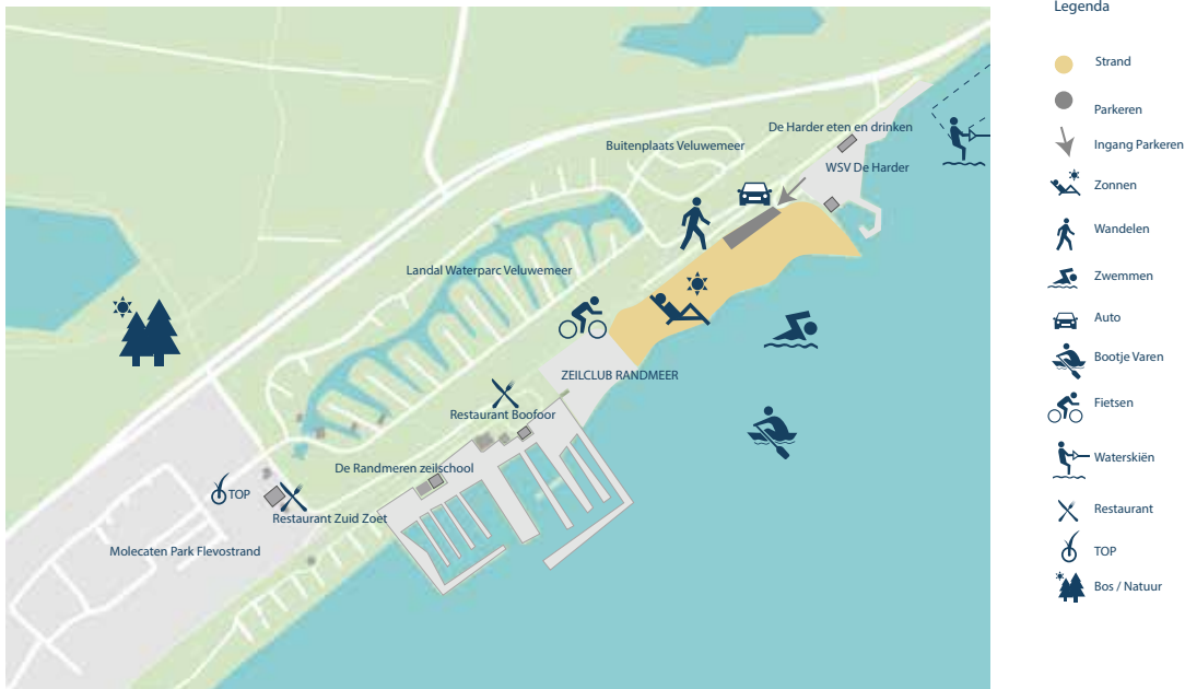
Afbeelding 17: Streefbeeld Harderstrand Noord

Het Harderstrand Noord richt zich op de rustzoeker en de stijlzoeker. De openbaarheid blijft behouden. Om het karakter van het strand te behouden worden hier geen fysieke wijzigingen door gevoerd. In overleg met Molecaten en omwonenden wordt onderzocht of en welke activiteiten op het strand kunnen plaatsvinden.